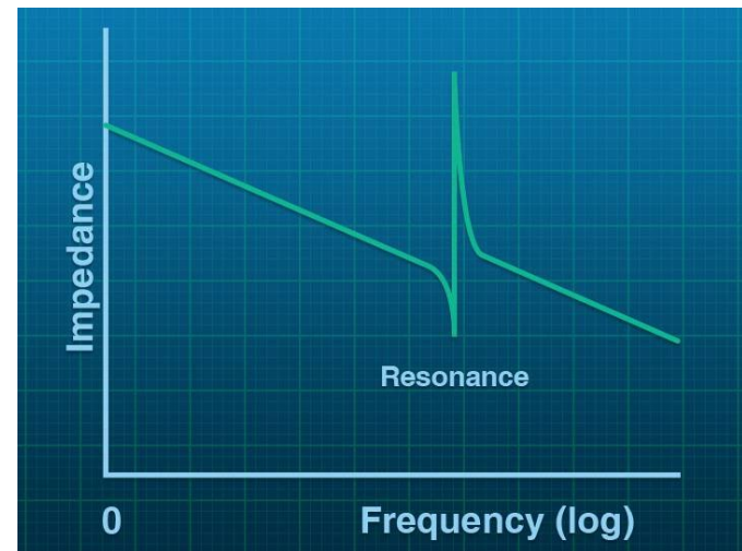
Fig. 2 Gráfica de respuesta a la frecuencia.

En esta parte del estudio se verifica que no se tengan condiciones de resonancia de los equipos con el sistema eléctrico. La resonancia es un efecto natural de amplificación peligrosa de corrientes en los equipos, por lo cual se tienen que hacer cambios de localización física o cambiar a otro tipo de filtros.